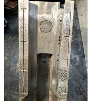
【送り台スライド部のキサゲ加工】