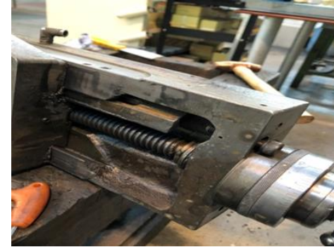
【刃物台送り台部の摩耗状況】