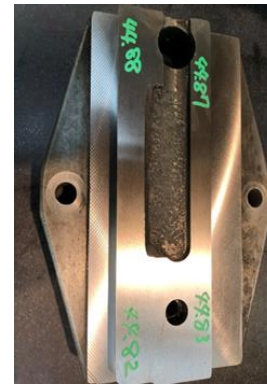
【研磨による片減りの修正】