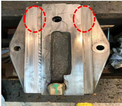
【刃物台部の旋回台の片減りが0.3mmある。】